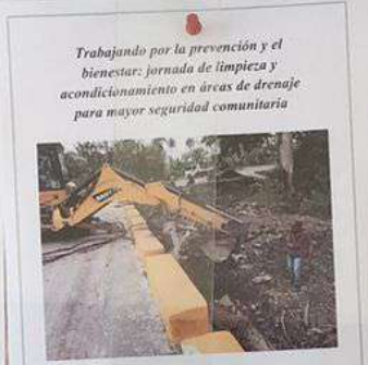
Trabajando por la prevención y el bienestar: jornada de limpieza y acondicionamiento en áreas de drenaje para mayor seguridad comunitaria