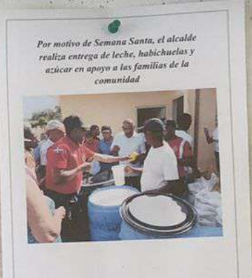
Por motivo de Semana Santa, el alcalde realiza entrega de leche, habichuelas y azúcar en apoyo a las familias de la comunidad